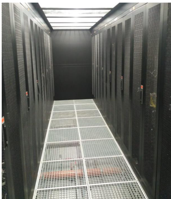
Výpočetní klastř Přírodovědecké fakulty UJEP - fotografie ze serverovny