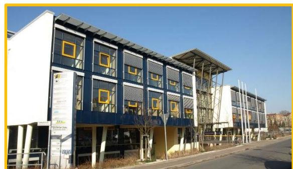
Obrázek: Inovační centrum Bautzen

Navštivte naše webové stránky nebo facebook pro aktuální informace.