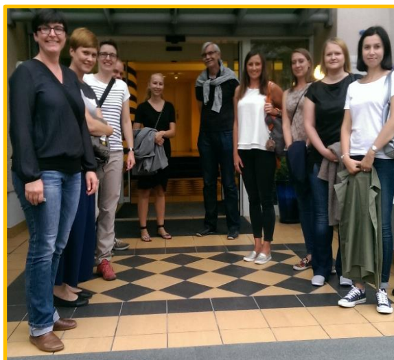
Obrázek: projektový tým projektu TRANS 3 Net