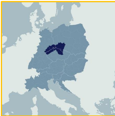
Obrázek: Analyzované trojmezí mezi Německem, Českou republikou a Polskem

V nejbližší době bude zahájen průzkum podporovatelů transferu na trojmezí Německa, České republiky a Polska. Cílem tohoto šetření bude představení profilu všech podporovatelů transferu, kteří jsou aktivní v daném regionu a přispívají k iniciaci a implementaci transferu inovací. Průzkum bude prováděn na základě dotazníku, který byl vytvořen ve spolupráci všech partnerů během prvních měsíců projektu. Šetření bude zahájeno v lednu 2017.